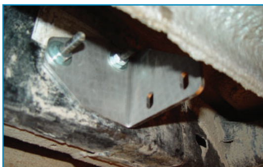
Pilt 1 / Pic. 1 / Рис. 1 / Bild 1