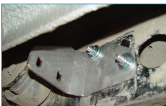
Pilt 3 / Pic. 3 / Рис. 3