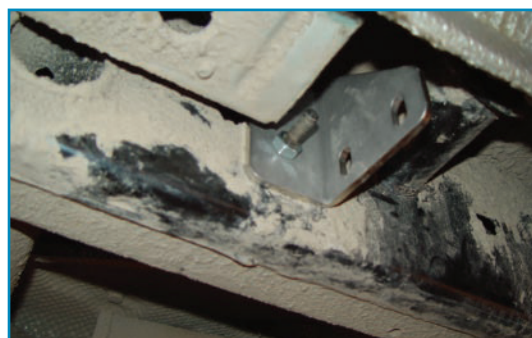
Pilt 2 / Pic. 2 / Рис. 2 / Bild 2