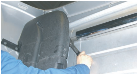
Pilt 3 / Pic. 3 / Рис. 3

Release air intake fastenings (pic. 1 and 2).