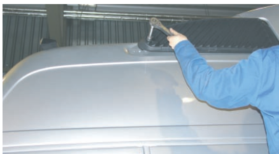
Pilt 1 / Pic. 1 / Рис. 1