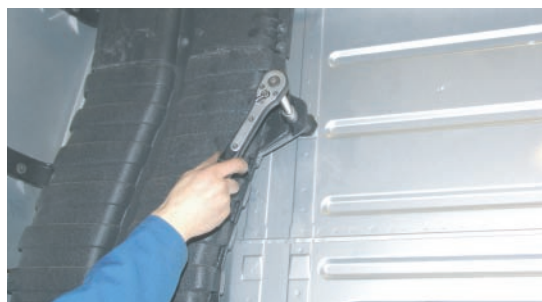
Pilt 2 / Pic. 2 / Рис. 2

Release air intake fastenings (pic. 1 and 2).