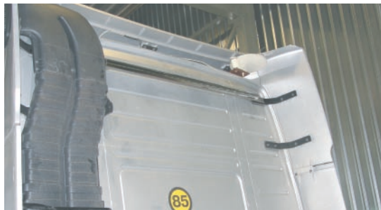
Pilt 4 / Pic. 4 / Рис. 4

Mount the rear lampholder (pic. 3 and 4).