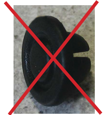
Bouchon de fermeture