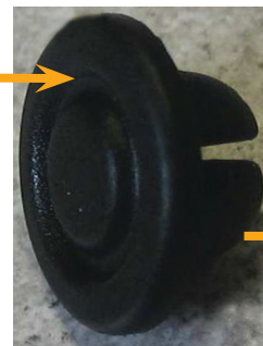
Bouchon de fermeture